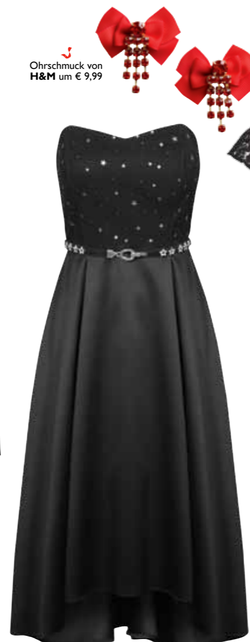
Ohrschmuck von H&M um € 9,99