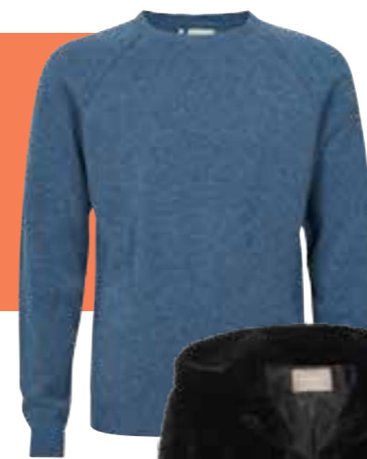
Weste von Orsay um € 29,99