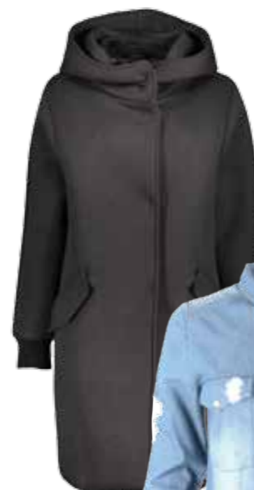
Mantel von NEW YORKER um € 69,95