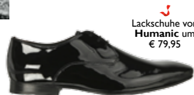
Lackschuhe von Humanic um € 79,95