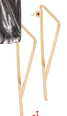
Ohrringe von Bijou Brigitte um € 7,95