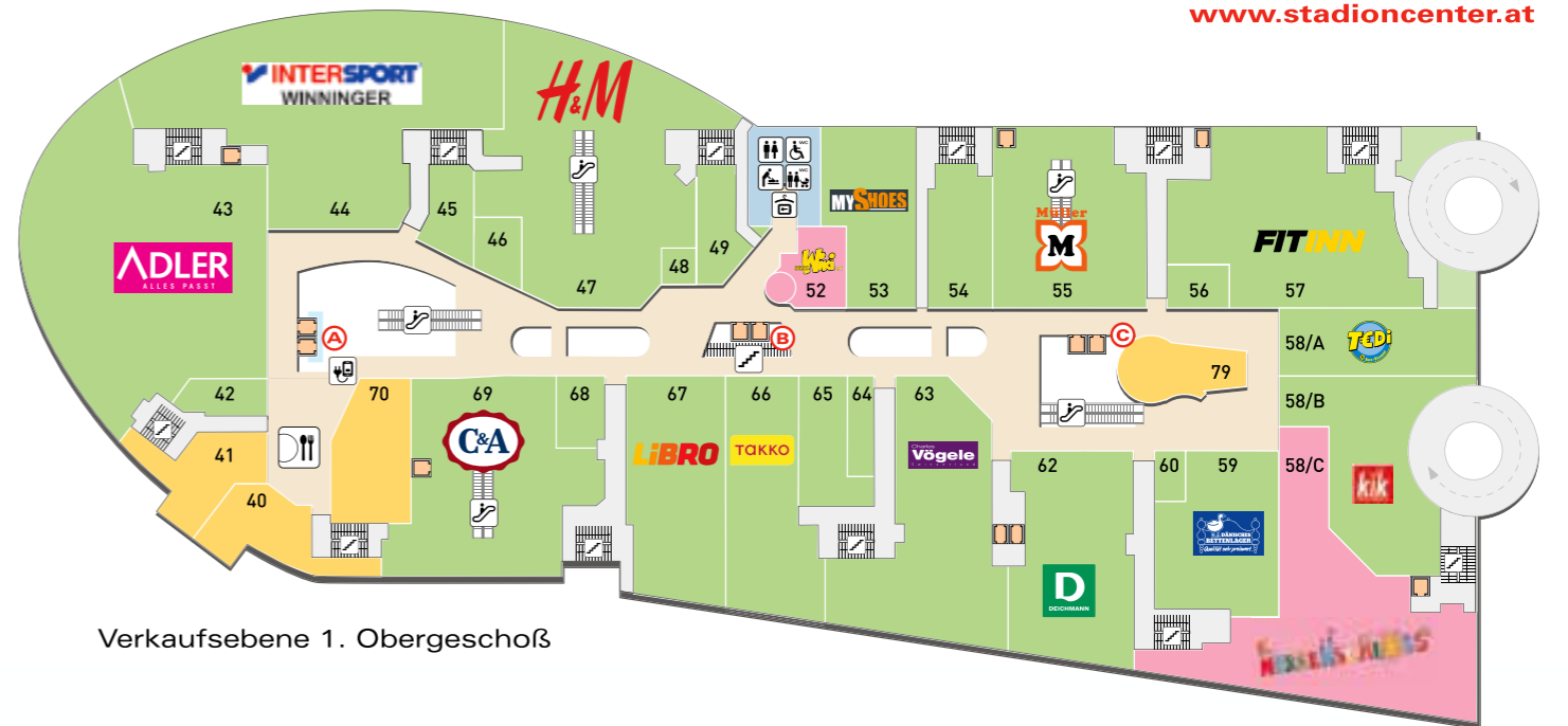
Verkaufsebene 1. Obergeschoß

SPENDENKONTO: IBAN: AT69 6000 0000 0706 4001 BIC: BAWAATWW