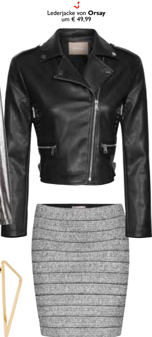
Lederjacke von Orsay um € 49,99