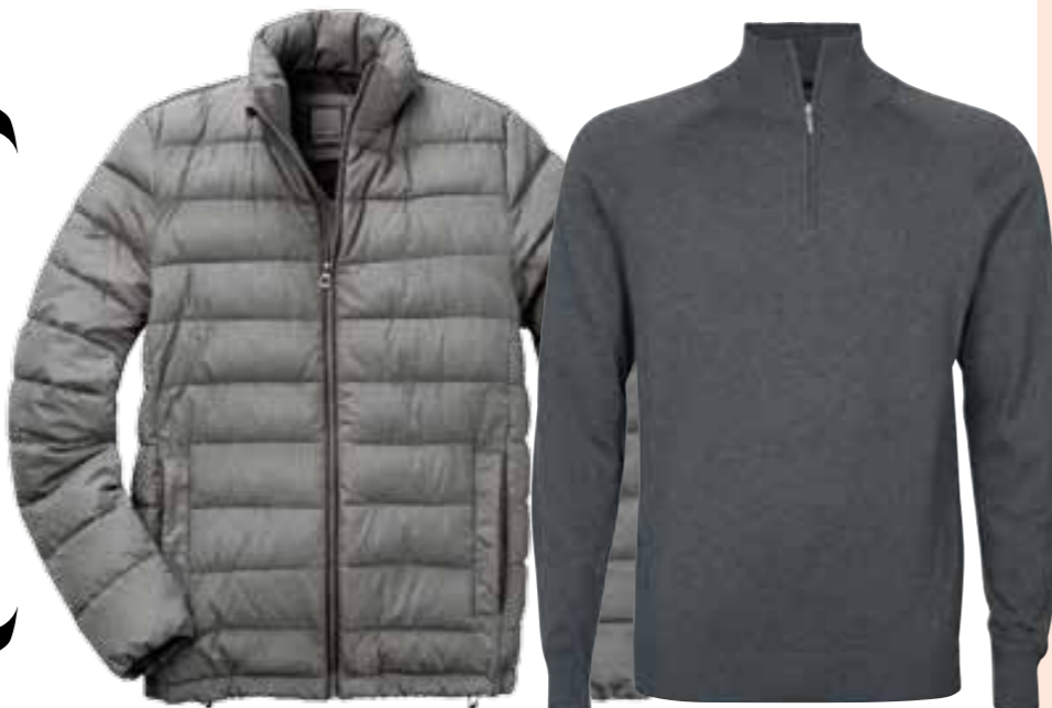
Jacke von Geox um € 229,-

Der neue Duft von Yves Saint Laurent ist eine Hommage an den selbstbewussten Mann. Das Eau de Toilette ist aromatisch, frisch und leicht und ganz nebenbei, die Frauen lieben es. Versprochen!