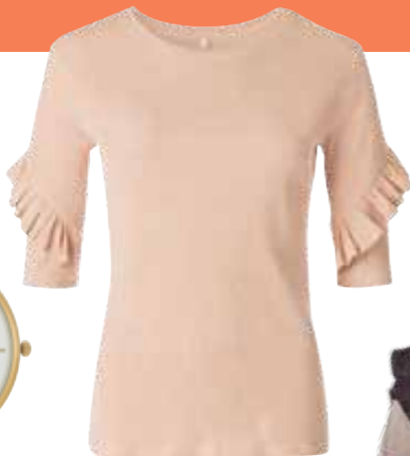
Shirt von mister*lady um € 15,99