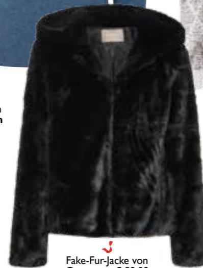
Fake-Fur-Jacke von Orsay um € 59,99