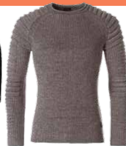
Pullover von mister*lady um € 25,99