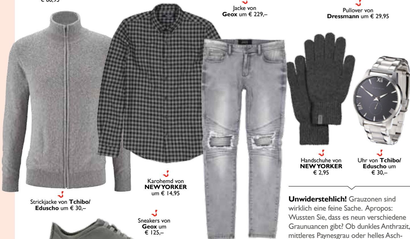
Handschuhe von NEWYORKER um € 2,95