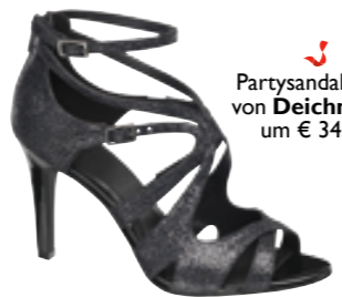
Partysandaletten von Deichmann um € 34,90