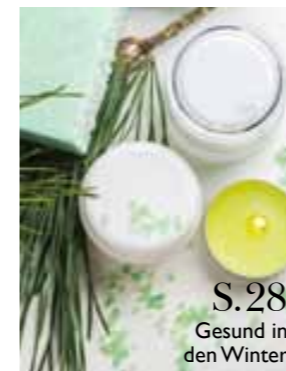
S.28 Gesund in den Winter