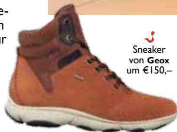
Sneaker von Geox um € 150,-

CHRISTINES TIPP: High-Sneakers kann man auch im Winter gut tragen!