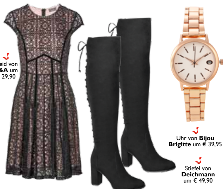
Uhr von Bijou Brigitte um € 39,95