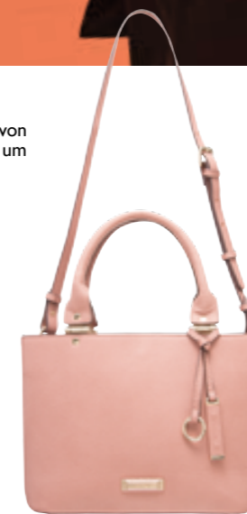
Tasche von Orsay um € 25,99