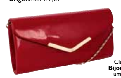
Clutch von Bijou Brigitte um € 24,90