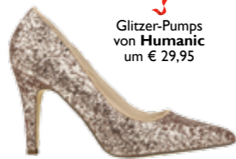
Glitzer-Pumps von Humanic um € 29,95