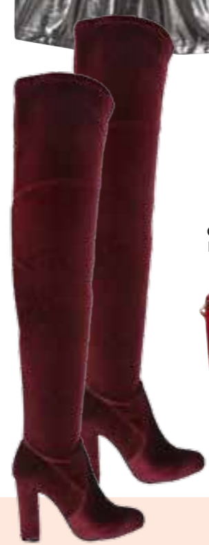
Overknees von Humanic um € 99,95