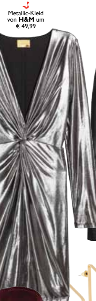
Metallic-Kleid von H&M um € 49,99