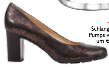
Schlangenoptik-Pumps von Geox um € 99,95