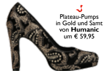
Plateau-Pumps in Gold und Samt von Humanic um € 59,95