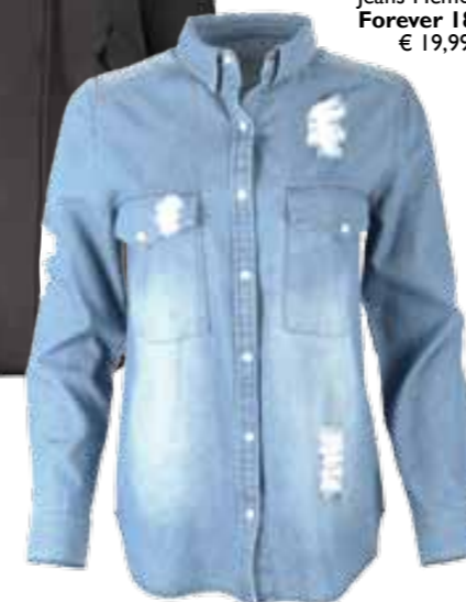
Jeans-Hemd von Forever 18 um € 19,99