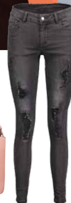
Jeans von NEW YORKER um € 29,95