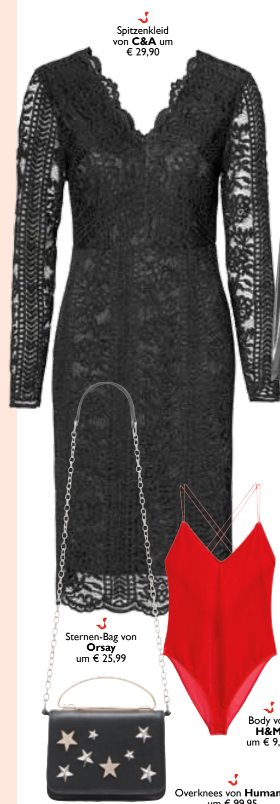
Spitzenkleid von C&A um € 29,90

GEGEN JAHRESENDE ZEIGEN SICH ALLE LADIES VON IHRER VERFÜHRERISCHEN SEITE. METALLIC-KREATIONEN TREFFEN JETZT AUF SÜNDIGE ROT-NUANCEN. EINFACH GRANDIOS.