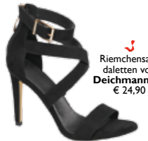
Riemchensandaletten von Deichmann um € 24,90