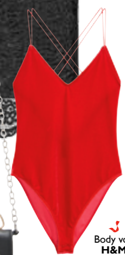
Body von H&M um € 9,99