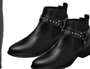
Boots von Orsay um € 35,99