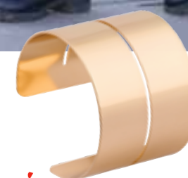
Armreif von Bijou Brigitte um € 9,95