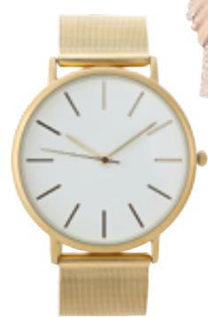
Armbanduhr von Bijou Brigitte um € 29,95