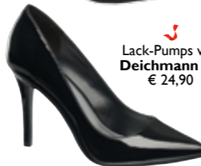
Lack-Pumps von Deichmann um € 24,90