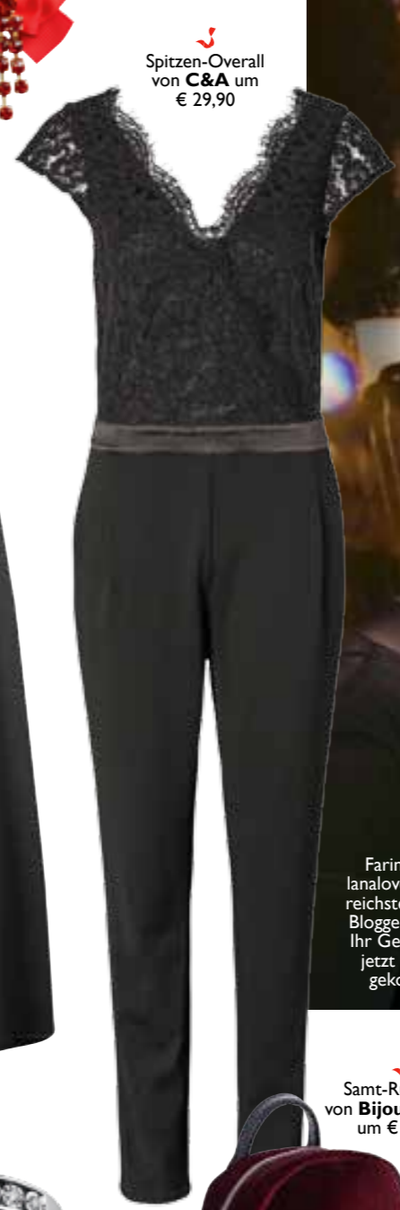
Spitzen-Overall von C&A um € 29,90