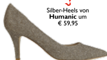
Silber-Heels von Humanic um € 59,95