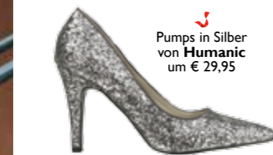
Pumps in Silber von Humanic um € 29,95