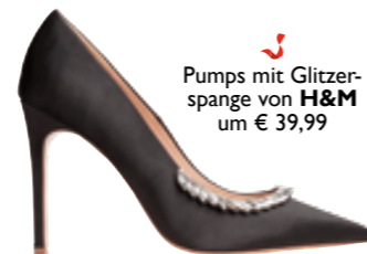
Pumps mit Glitzer-spange von H&M um € 39,99