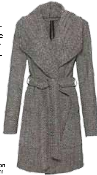
Mantel von Takko um € 49,99

CHRISTINES TIPP: Mäntel im Trench-Coat-Stil sind Klassiker, diesen Winter aber besonders angesagt!