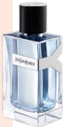
Duft „Y“ von Yves Saint Laurent bei Drogerie Müller um € 66,95

BITTE VON KOPF BIS FUSS IN DIESER FARBFAMILIE BLEIBEN, DENN DER FARBTREND MUTET SERIÖS AN UND KANN AUCH IM BÜRO GETRAGEN WERDEN.